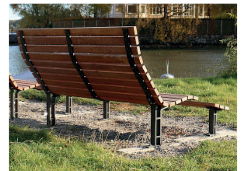
Generösa soffor under stora eken